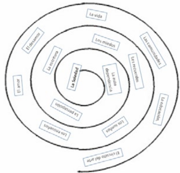
Figura 2. Acercamiento en espiral a las "categorías emergentes"

El método hermenéutico fue dando posibilidades de reflexión y de análisis parciales en el curso de las comprensiones. Este segundo método interactúa con el anteriormente descrito, en tanto la observación de los fenómenos y sus interpretaciones se tornan inseparables, como lo señala Martínez (2008), no necesariamente de uso exclusivo en la interpretación de resultados, se trata de interpretaciones en el trayecto investigativo, en pro de la comprensión de los fenómenos estudiados y de las motivaciones que los sujetos revelan para sus procesos de creación artística en los contextos educativos a los cuales pertenecen y en la relación maestro-estudiante. Las entrevistas permitieron no solo "comprender la literalidad de las palabras", sino también, las individualidades de los estudiantes de artes involucrados en la investigación.